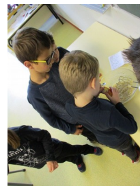
...de la levure