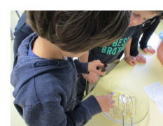
...de l'extrait de vanille