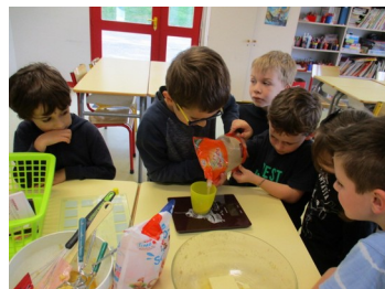
...de la cassonade et du sucre