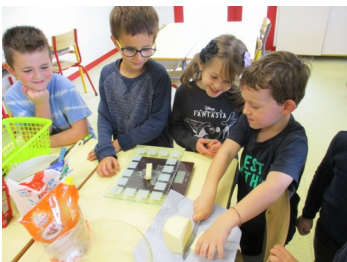
...du beurre et 1 oeuf