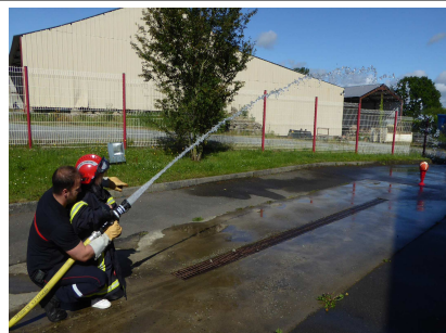
On vise le ballon de basket et on essaye de le « dégommer ». C'est nous qui dirigeons la lance et on l'éteint même !