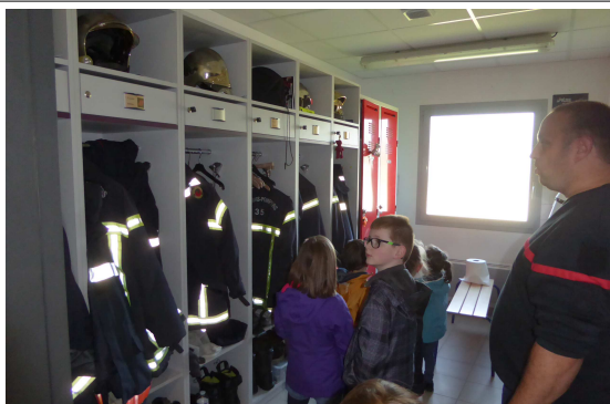
Les vestiaires L'ambulance-->