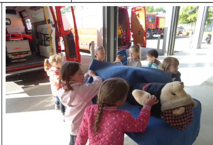
« Tamalou » est blessé ...