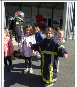
La veste de feu des pompiers est un peu grande pour nous... !