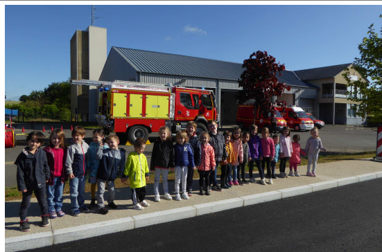
Arrivée à la caserne : les camions sont déjà dehors et il fait très beau ! La route est toute neuve et toute belle.