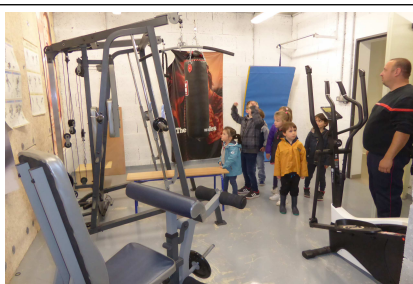
La salle de gym des pompiers