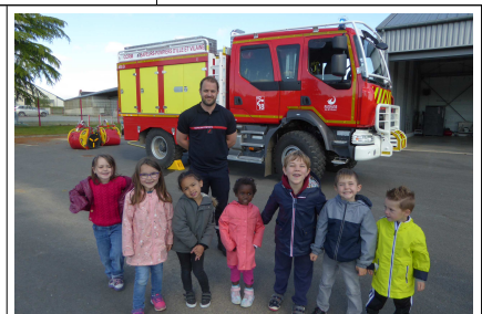
Le camion pour les feux