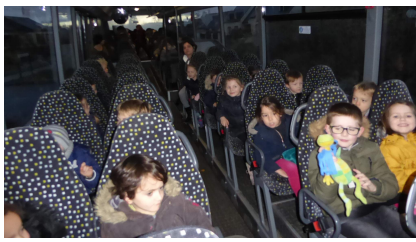
On a pris le car jusqu'à Rennes