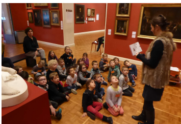
On a réussi à répondre à ses questions. A la fin elle nous a dit avec le garde qu'on avait été très sage et qu'on avait très bien répondu ! On peut revenir !