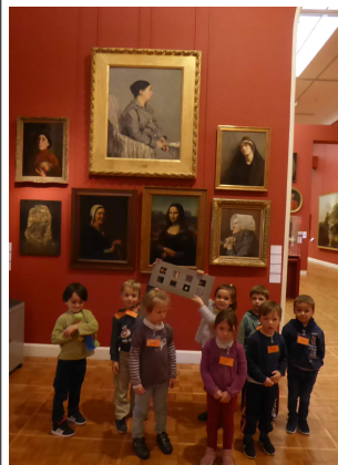
C'était trop bien !