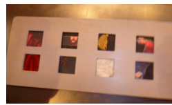
Après on a fait une chasse au trésor : on devait retrouver des tableaux grâce à des indices : de la dentelle, du tissu rayé, une moustache....