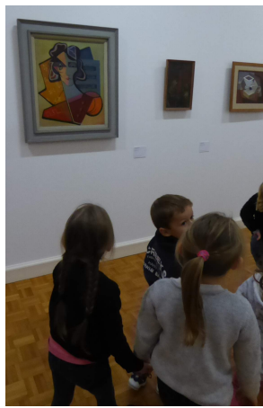
On a vu un tableau comme Picasso (la tête de travers)