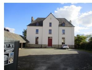
l'ancienne école des garçons