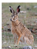
le lièvre d'Europe

Le serpent est un reptile. Le lièvre d'Europe est un mammifère. Les mammifères allaitent leurs petits.