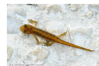
le triton palmé

Il y a aussi des amphibiens : on a vu des grenouilles. D'abord, c'est un têtard. Quand il grandit, il perd sa queue. La grenouille vit dans la mare. Le triton est palmé.