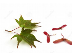
feuille et graine d'érable

Enfin, nous sommes rentrés à l'école. En chemin, nous avons croisé le cimetière, la caserne des pompiers et l'ancienne école des garçons.